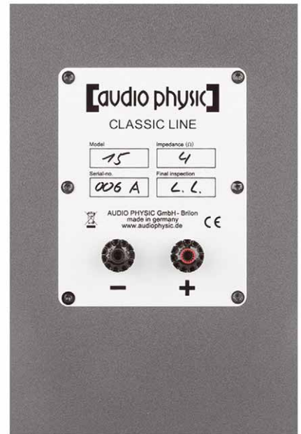
Da der typische Audio-Physic-Kunde eher kein Bi-Wiring/Bi-Amping nutzt, verbaut der deutsche Hersteller eine kontaktfreudige Single-Wiring-Variante auf einem soliden Terminal

ganz anderer Musik. Der Altmeister Gary Numan darf ran, mit dem Titel „Ghost Nation“ aus dem Album „Savage (Songs from a Broken World)“. Numans prägnant nörgelnde Stimme kommt bestens zur Geltung und verbreitet kurzfristig Endzeitstimmung im Hörraum. Doch die effektgeladenen Synthie-Sounds fegen diese direkt wieder hinweg und sorgen für ein Grinsen im Gesicht. Die Classic 15 spielen energiegeladen, mit stets präzisen, trockenen Bässen und Informationen im Überfluss. Vom NAS spielen wir diverse, uns bestens bekannte Teststücke aller Genres über die Audio Physic ab. Natürlich sind die Dire Straits mit von der Partie, und auch hier zeigen sich die Classic 15 in bester Laune. Die große Bühne, die von den schlanken Standlautsprechern aufgebaut wird, ist wirklich beachtlich. Darauf stehen die Musiker präzise platziert auf ihren exakt zugewiesenen Positionen. Hier und da könnte die Bassdrum etwas voller tönen, eine ganz freie Aufstellung fernab