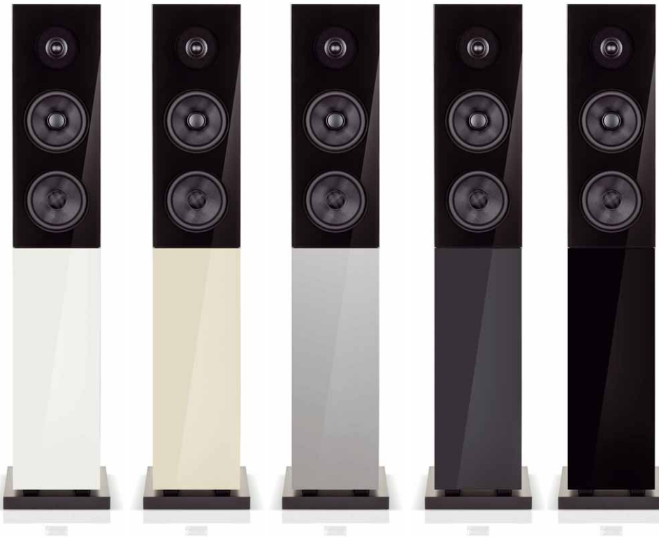
Einige Farbvarianten der Classic 15 haben wir hier abgebildet: Zu sehen sind die Standardfarben Schwarz und Weiß sowie die aufpreispflichtigen Sonderfarben Anthrazit, Silver Gray und Pearl White. Auf Wunsch sind zahlreiche andere Farben erhältlich. Der Preis steigt dadurch um 100 Euro

aller Wände lässt die Classic 15 eher asketisch erscheinen. Näher an der Rückwand scheint der bessere Stellplatz zu sein, da hier der Punch im Bass etwas zunimmt. So machen dann auch „Rage Against the Machine“ richtig Laune – erstaunlich, was die kleinen Standlautsprecher an Pegel abkönnen, ohne im Klangbild aufzuweichen. Wieder zurück zu normalen Pegeln, lassen wir den Test mit Cassandra Wilson ausklingen. Deren temperamentvolle, farbenreiche Stimme kommt über die Classic 15 perfekt zur Geltung und produziert ab der ersten Silbe eine wohlige Gänsehaut. Auch hier steht die Stimme wieder wunderbar transparent im Raum.