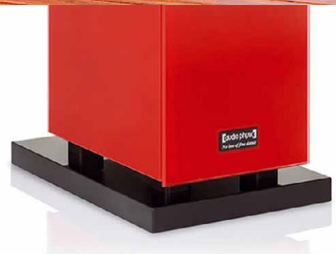
Luft atmet der Lautsprecher über einen Schlitz im Gehäuseboden. Damit der schlanke Standlautsprecher sicher auf dem Boden steht, sind in den soliden MDF-Sockel vier höhenverstellbare Metallspikes eingedreht

seine Classic 15 klanglich noch weiter optimieren möchte, kann sie auf die sehr aufwendig konstruierten „VCF II Magnetic“ Füße von Audio Physic setzen. Sie entkoppeln die Lautsprecher vom Untergrund und schonen empfindliche Böden.