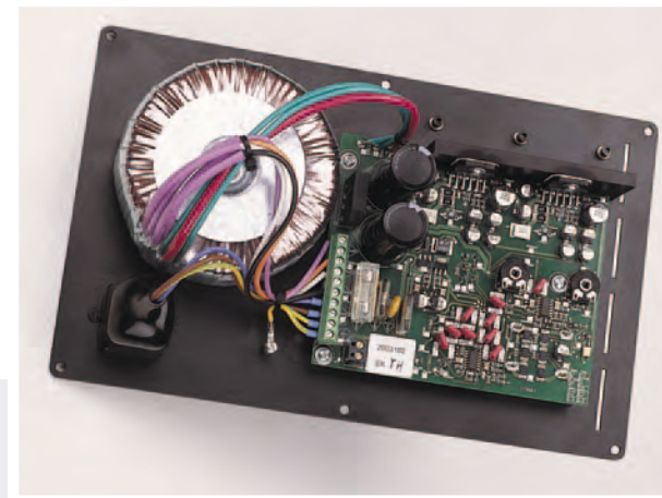
Die nach neuesten Erkenntnissen in Deutschland gefertigte Subwoofer-elektronik bildet die Basis für eine beeindruckende Tieftonwiedergabe.