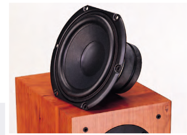
Lautsprechersysteme mit kräftigen Antrieben und eine 25 mm Gewebekalotte sorgen für einen dynamischen und ausgewogenen Klangcharakter. (hier Ausführung Kirsche)