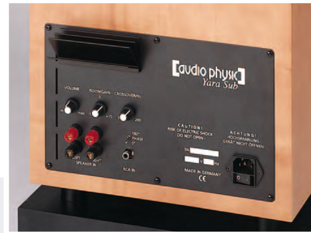
Praxisgerechte Anschluß- und Bedienungselemente zeichnen den YARA Subwoofer aus.

Wer die YARA Klangsphären einmal erlebt hat, möchte sie nicht mehr missen.