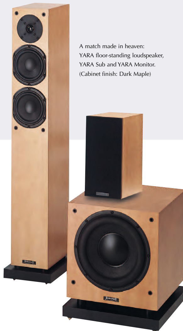
A match made in heaven: YARA floor-standing loudspeaker, YARA Sub and YARA Monitor. (Cabinet finish: Dark Maple)