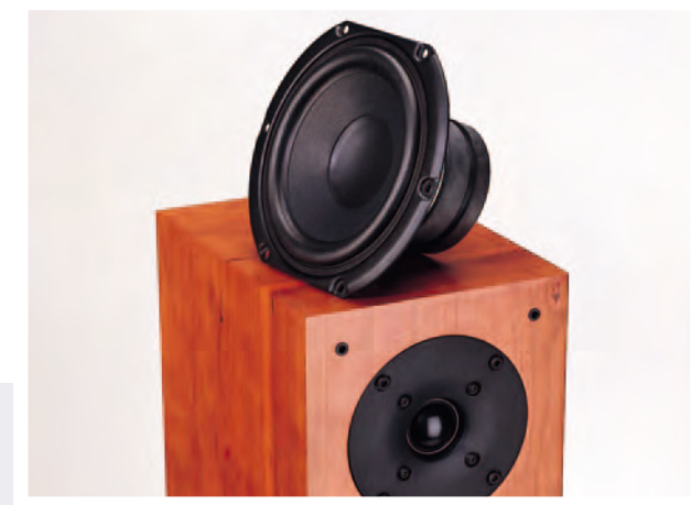
Drivers with powerful motors and a 1" fabric dome tweeter ensure dynamic sound and well-balanced tonal blend. (Cabinet finish: Cherry)