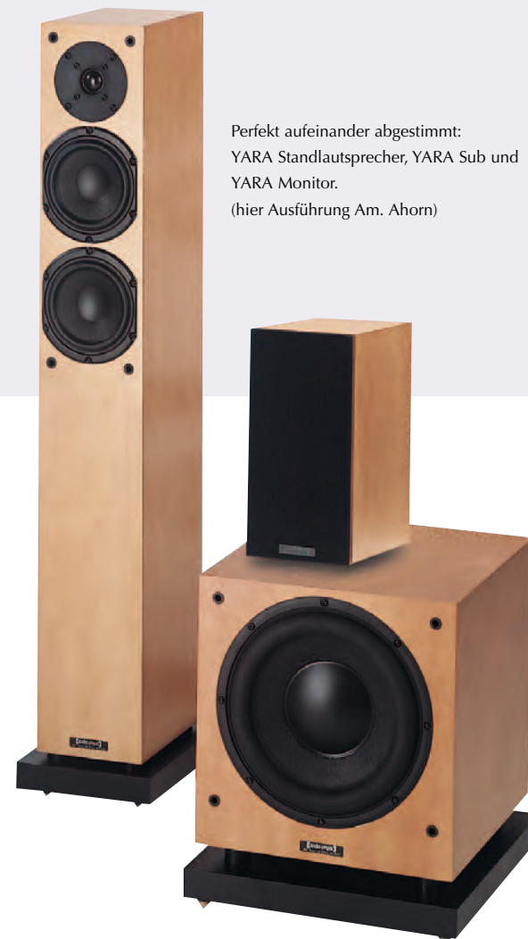
Perfekt aufeinander abgestimmt: YARA Standlautsprecher, YARA Sub und YARA Monitor. (hier Ausführung Am. Ahorn)

Die Bausteine des YARA Mehrkanal- Systems lassen sich vielfältig miteinander kombinieren. Der Kreativität sind keine Grenzen gesetzt. YARA Hörer haben die Möglichkeit, ihre Mehrkanal-Anlage Komponente für Komponente aufzubauen. Entscheidend für die Auswahl der Module sind allein Ihr Platz, Geschmack und Budget.