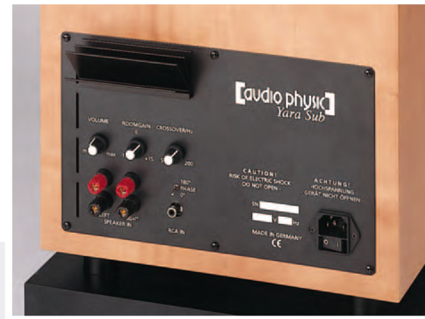
The YARA Subwoofer - easy to connect and easy to operate.

To complete the musical experience, add the YARA Subwoofer which provides additional weight and delivers an even more accurate spatial image.