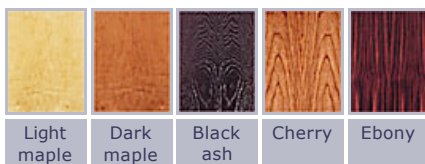
Audio Physic veneers at a glance