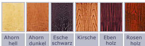
Audio Physic Furniere im Überblick