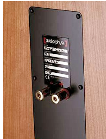
Anschluss terminal mit vergoldeten WBT-Pol-Klemmen

Wer Audio Physic kennt, weiß, dass „Me too“ Produkte unsere Sache nicht sind. Wir gehen in der Entwicklung mit höchster Sorgfalt vor, kein klangliches Detail darf verloren gehen. Das macht unsere Produkte weltweit so begehrt. Um mit dem Avanti Center das optimale Klangergebnis zu erzielen, haben wir die Potenziale voll ausgeschöpft.