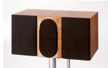
Avanti Center loudspeaker with mid-section grille cloth