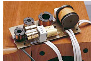
Hochwertige Frequenzweiche und Innenverkabelung