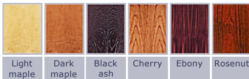
Audio Physic veneers at a glance