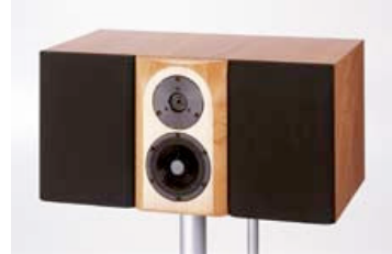
Avanti Center ohne mittlere Bespannung