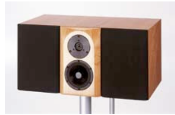
Avanti Center loudspeaker without mid-section grille cloth