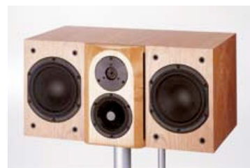
Avanti Center loudspeaker without grille cloth

Whether two-channel music, multi-channel music or movie soundtracks, in either a busy living environment or a dedicated theater room, an Audio Physic system will deliver the sound and look for the home entertainment experience you desire.